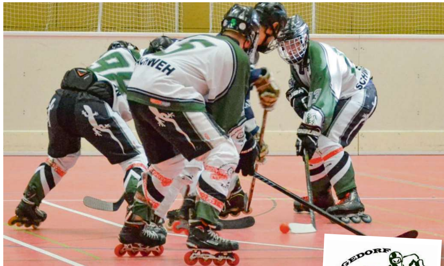
Die U19 der Lizards in Aktion auf dem Spielfeld