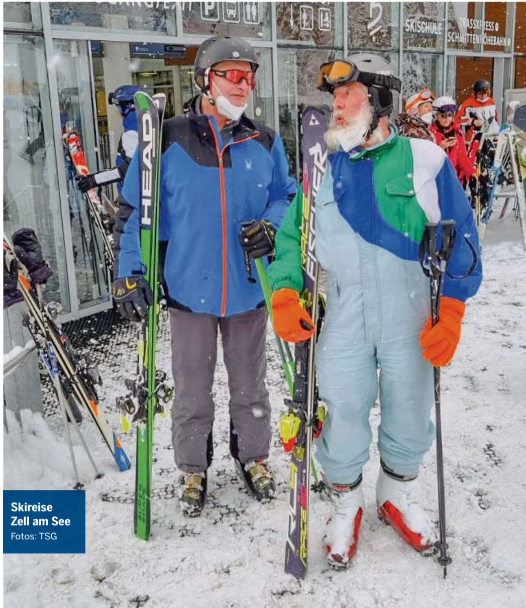
Skireise Zell am See

► Ausführliche Informationen über die Angebote und Reisen sind auf der Abteilungshomepage (tsg-bergedorf.de/skiabteilung) zu finden. Oder man informiert sich am Stand der Ski-Abteilung im Rahmen der TSG Days am 11.9.2022 im TSG Sportforum. Dort wird Torsten Hackmann für alle Fragen persönlich zur Verfügung stehen