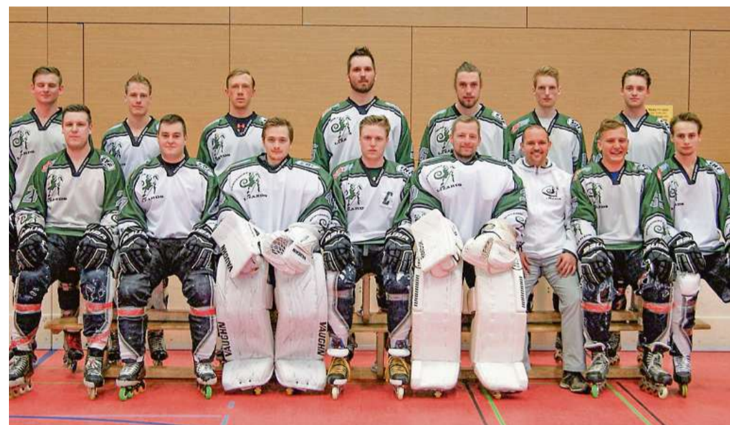
Mannschaftsfoto der Lizards Herren I